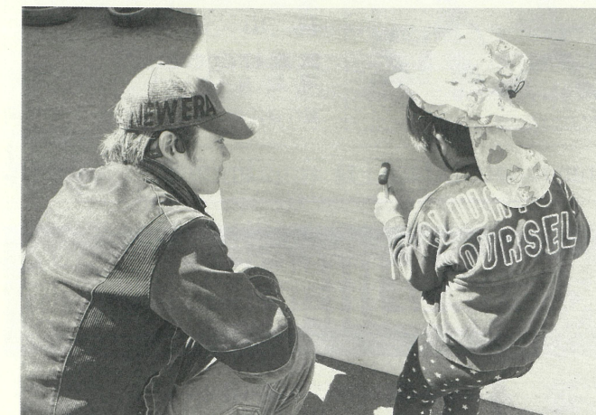
▲釘打ちを教える大懸青年部長