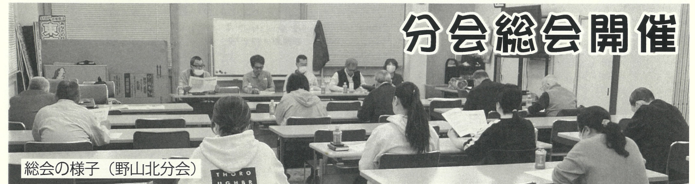
総会の様子(野山北分会)

3月29日、多くの分会(大和南は4月5日)で分会総会が行われました。1年の締めくくりとなる総会では各分会がその年の総括を行い、次年度方針について話し合いました。その中で4月から迎える「仲間を増やそう月間」に向けて、具体的にどのような方策について話し合う分会もあり、各分会が月間へ向け分会の士気を高める場となる有意義な総会となりました。