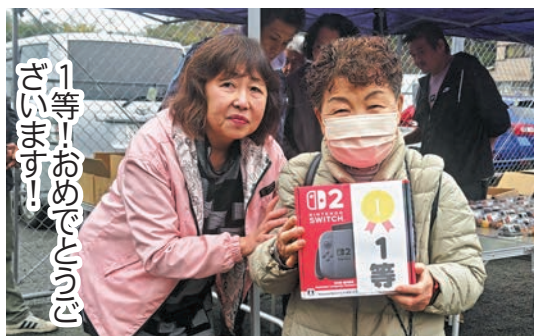
1等1おめでとうございます！

役員賞などの豪華賞品が目白押し。数多くの賞品を前に、参加者は自分の名前が呼ばれる瞬間を心待ちにしながら、ドキドキの抽選会を過ごしました。