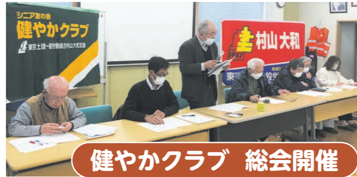
健やかクラブ 総会開催

題した学習を行い、健やかクラブ会員の高齢世代にとっては年々厳しくなっていく生活についての学習となり、公助から共助へと移り変わり憲法25条で補償されている人権より財政を優先している国の政策などについての現在と、聞こえはいいが中身は働ける限り働