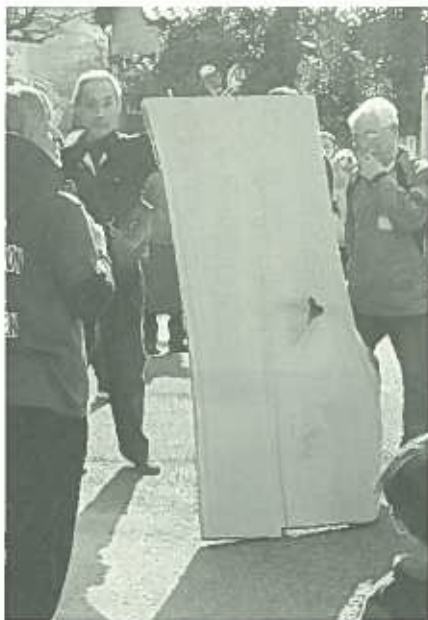
断面が素晴らしい…技術です