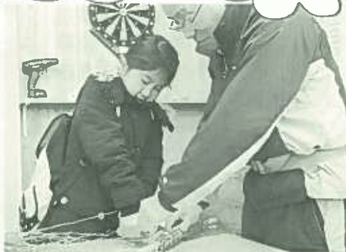
里山民家さんのミニ竹ぼうきうまく出来た?