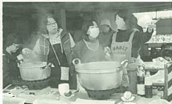
主婦の会の芋煮とすいとんは今回も大好評!