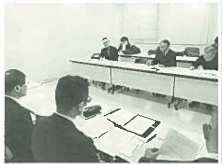
東大和市での様子

新春恒例になった「自治体キャラバン」が1月18日、足立区を皮切りに都内全区市町村を対象に、はじまりました。 公共現場、自治体などに働く労働者の処遇改善・労働環境改善、入札についてなど懇談・要望しました。支部は、25日に東大和市、28日に武蔵村山市で行いました。