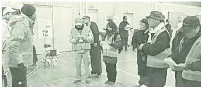
説明を聞く、参加者

東京・福岡・大阪に続く原告勝訴の判決です。京都判決の画期的なところは、業界シェアの10%以上の企業は、社会的責任があるとはじめて「企業責任」認めたところで 原告団・支援組合は、この判決をもってニチアス本社に申入れ行動を行いました。(労働対策部)