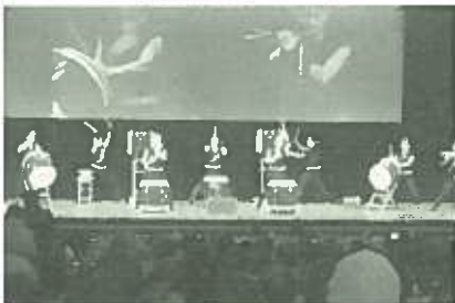
本部50周年記念の様子