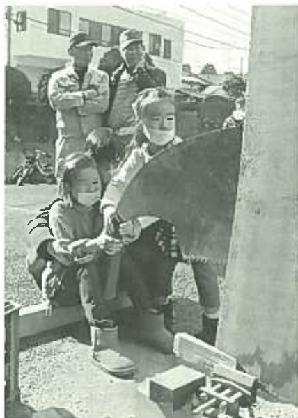
大きなのこぎり、うごくかな？