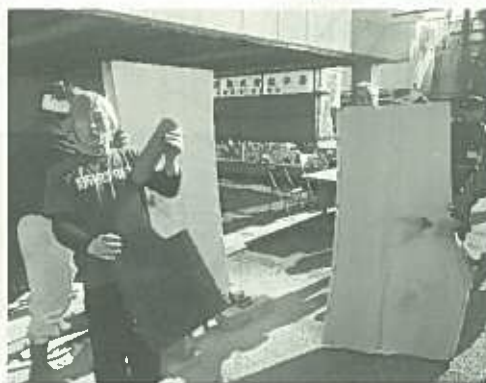
キレイに割れました